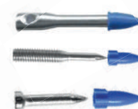
PINOS 1/4" E 3/8" PARA FERRAMENTAS DE AÇÃO DIRETA