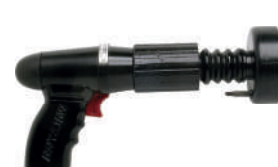
FERRAMENTA AÇÃO DIRETA DFG-40