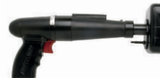
FERRAMENTA AÇÃO DIRETA DSI-90