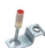
PINO COM SUPORTE ROSCADO