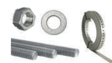
BARRAS, PORCAS, ARRUELAS E FITAS