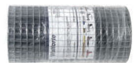
WALFORTE TELA PARA FACHADA