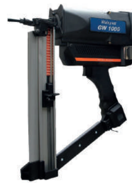
FERRAMENTA GW 1000